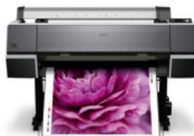
Epson Stylus Pro 9700