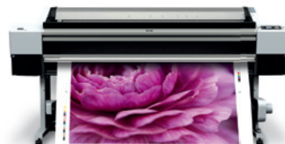
Epson Stylus Pro 11880