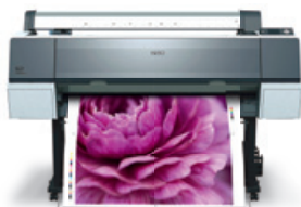
Epson Stylus Pro 7900