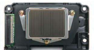
Druckkopftechnologie der Epson Großformatdrucker