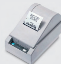
Etikettendrucker TM-L60 II

EPSON Deutschland GmbH • Otto-Hahn-Str. 4 • D-40670 Meerbusch • www.epson.de